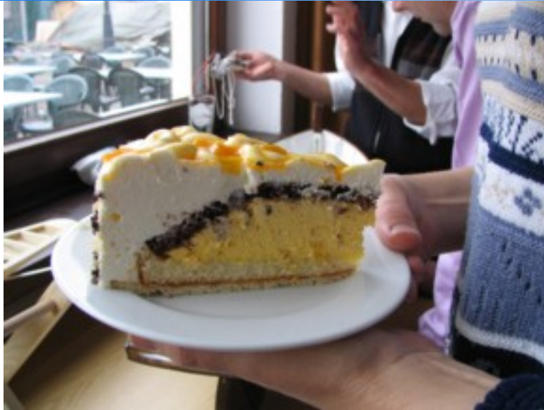
Eine etwas andere "Ladung".

Wir konnten viel erzählen und von einander lernen. Vor allem aber haben wir alte Freunde getroffen und ein paar schöne Stunden gemeinsam verbracht! Herzlichen Dank und auf baldiges Wiedersehen !