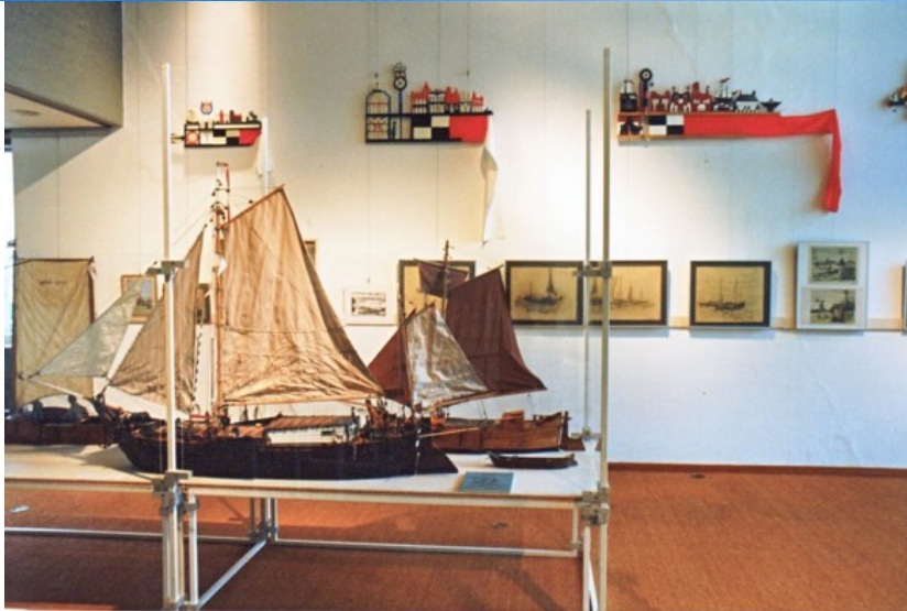
FELICIANA, weitere Modelle von H. Burchert, Bilder von H. Pridöhl, Kurenwimpel