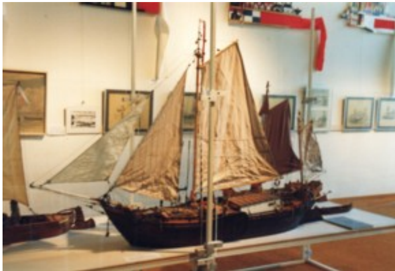
Der ostpreussische Reisekahn FELICIANA, B.J. 1852, von Dieter Kettelhut. M: 1:15 - La. 236,6 m