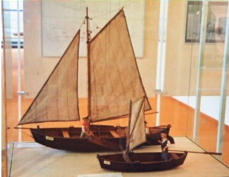
Weitere Modelle von H. Burchert